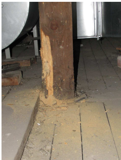
Fot. 7 Podstawa słupa lokalnie porażona przez owady – techniczne szkodniki drewna