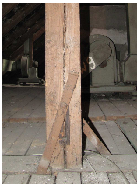
Fot. 9 Wszystkie stalowe łączniki oczyścić i zabezpieczyć antykorozyjnie za pomocą powłok malarskich