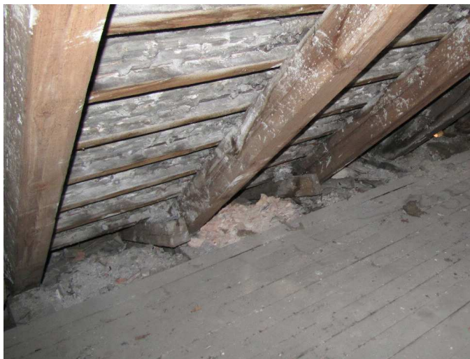
Fot. 4. Końcówki krokwi zasypane gruzem