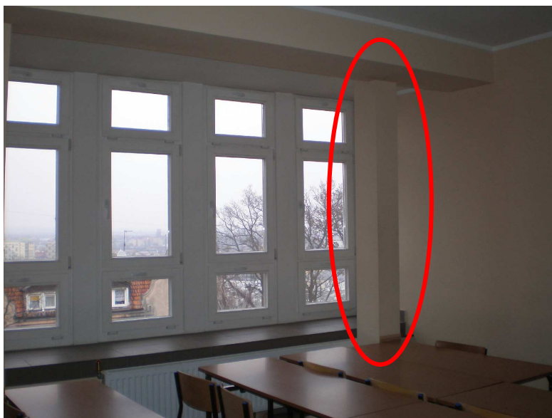
Fot. 10 Przy większości słupów usunięto miecze